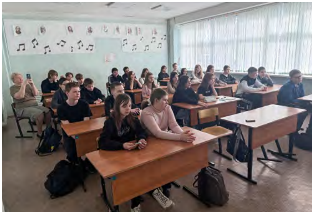
Ученики 7-го класса школы № 4 Линёво