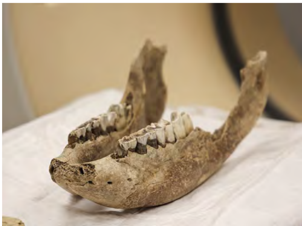
Нижняя челюсть детеныша шерстистого носорога, сохранившаяся почти полностью