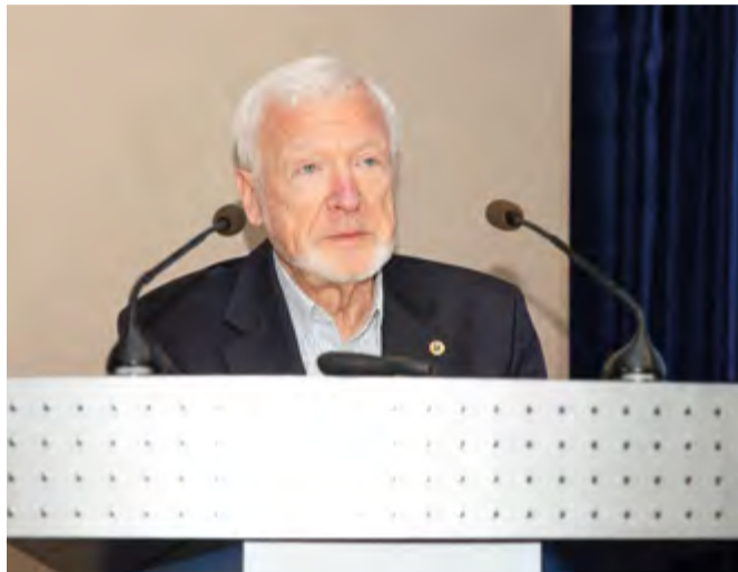
В. И. Молодин